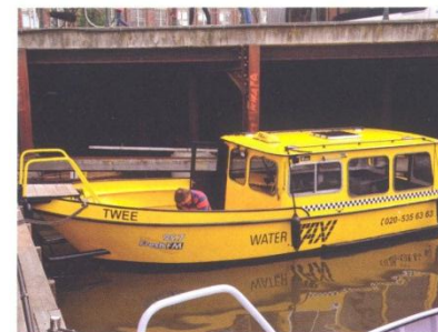
Auch in den Grachten verkehren „Taxis“

So ist heute die größte Zentrale, TCA – Taxi Centrale Amsterdam, Dreh- und Angelpunkt des Gewerbes. 1.300 der 2.000 Fahrzeuge gehören zu dieser Flotte. Die Lenker (es können sich auch zwei Lenker ein Auto teilen) erwerben sogenannte Zertifikate. Insgesamt hat TCA 1.530 Zertifikate ausgegeben. Jedes Zertifikat berech-