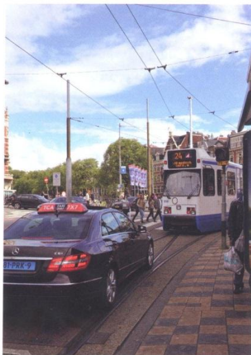
Rund 2000 Taxis gibt es in Amsterdam. Ein Großteil ist berechtigt die Straßenbahngleise mitzubenützen

Bis ins Jahr 2000 war das Taxigewerbe relativ stark reglementiert, dann erfolgte wie fast überall in Europa eine weitgehende Liberalisierung. Um in das Gewerbe einzusteigen brauchte man keine fachlichen Voraussetzungen mehr – mit den üblichen Folgen: Die