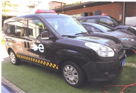
Die Leih taxis von TCA sind Fiat Doblos mit umweltfreundlichem Elektroantrieb

TCA vermittelt wie die Wiener Zentren über das österreichische fms/Austrosoft System.