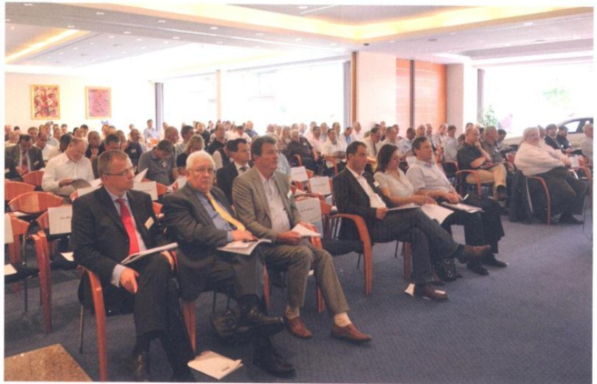
Die fms-Familie ist beeindruckend: 100 Zentralen in acht mitteleuropäischen Ländern vermitteln (in fünf Sprachen) an ca. 30.000 Fahrzeuge rund 100 Millionen Fahrten pro Jahr

An beiden Tagen fanden zahlreiche spannende Vorträge und Workshops statt. Dem Thema „Neue Bestell- und Vermittlungssysteme“ war ein besonders breiter Raum gewidmet. Auf der einen Seite bieten neue Technologien wie Apps für Smartphone gute Chancen sowohl neue Kundengruppen anzusprechen als auch den Ablauf der