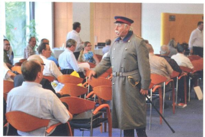
Hauptmann von Köpenick sorgte für Heiterkeit bei den Teilnehmern. Friedrich Wilhelm Voigt (1849 - 1922) war ein aus Ostpreußen stammender Schuhmacher. Bekannt wurde er als der Hauptmann von Köpenick durch seinen spektakulären Überfall auf das Rathaus von Köpenick bei Berlin, in das er am 16. Oktober 1906 als Hauptmann verkleidet mit einem Trupp gutgläubiger Soldaten eindrang, den Bürgermeister verhaftete und die Stadtkasse raubte

sen sich wertvolle Anregungen schöpfen. Besonders interessant war ein Besuch in der Berliner Zentrale, die aus dem Zusammenschluss von vier Funkzentralen hervorgegangen war und auf dem Gelände des ehemaligen VEB Taxi im früheren Ostteil der Stadt beheimatet ist.